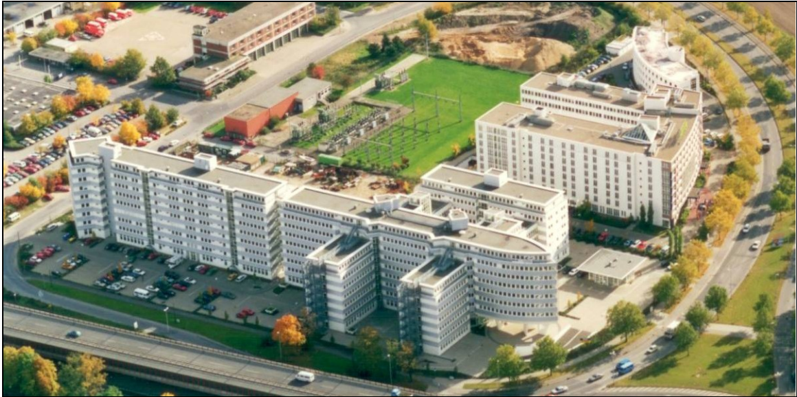
Luftbildaufnahme (Stand: Oktober 1994)