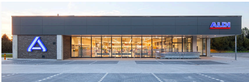
Neue Filialen bauen wir als modernen Flachbau mit großzügigen Fensterfronten.

Seit 2012 haben wir die Modernisierung und den Umbau von Bestandsfilialen als auch den Bau neuer Filialen vorangetrieben. In großzügig gestalteten Filialen wollen wir den Einkauf für unsere Kundinnen und Kunden noch einfacher und angenehmer machen. Sie sollen sich einfach wohlfühlen bei uns. Dafür sorgen ein neues Lichtkonzept, frische Farben, breitere Gänge und eine weitaus übersichtlichere Warenpräsentation.